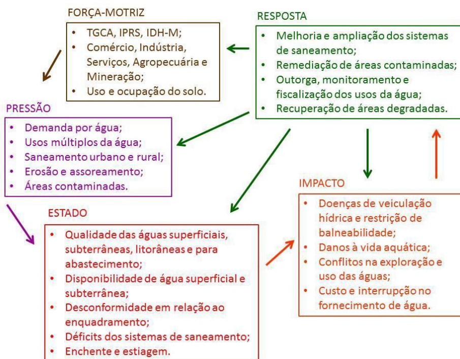
Figura 2 - Interrelacionamento de indicadores do Relatório de Situação através da metodologia FPEIR.

para a Força-Motriz, as Pressões, o Estado ou para os Impactos, conforme ilustrado a seguir: